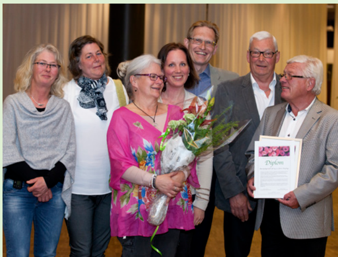
Harplinge Steninge var glada vinnare av Årets kyrkogårdsförvaltning 2017.